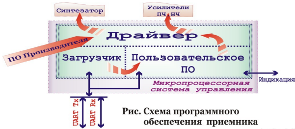
Рис. Схема программного обеспечения приемника